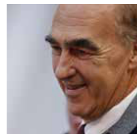
DICHIARAZIONE HELMUTH KOECHER Patron e fondatore Merano WineFestival

Un'immersione in simposi scientifici, tavole rotonde, masterclass e molto altro ancora per comprendere l'affascinante mondo del vino in anfora.